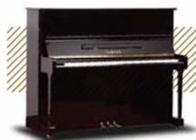
YAMAHA U1 ¥129,600~ (税込み)