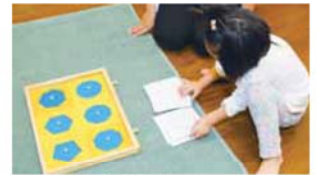
感覚的に幾何学図形を理解

どもたちはおおむね6カ月～1歳半、1歳半～3歳、3歳～6歳の3クラスに分かれて過ごします。年長さんが小さい子の世話をし、年下の子はお兄さんたちに憧れる関係の中で社会性が育まれます。「月齢はクラス分けの目安。子どもの発達やクラスの状況に合わせて、年度の途中で進級します」