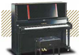
YAMAHA YU-5 ¥561,600~ (税込み)