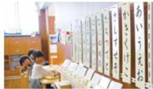
ひらがなを学ぶパネル