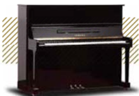
YAMAHA U3H ¥248,400~ (税込み)