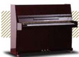
Fukuyama&Sons ¥162,000~ (税込み)