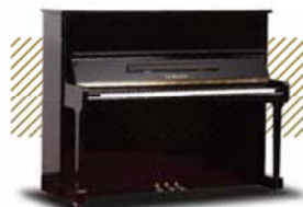
KAWAI KU-1 ¥194,400~ (税込み)