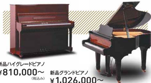
新品ハイグレードピアノ ¥810,000~ (税込み) 新品グランドピアノ ¥1,026,000~ (税込み)