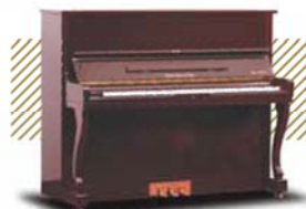
Wilson A-300 ¥280,800~ (税込み)