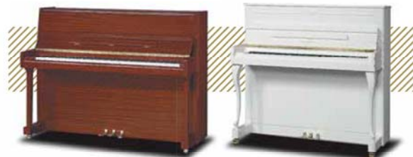
¥356,400~ (税込み) ★アウトレット対象商品は 25%~40%OFF!!