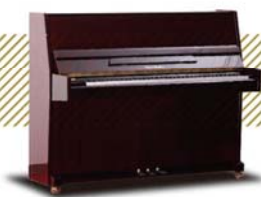
Fukuyama&Sons ¥162,000~ (税込み)