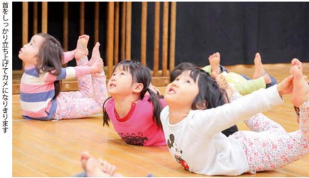
首をしっかり立て上げてカメになりきります