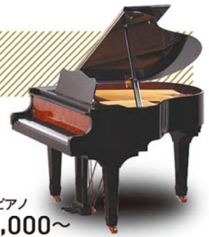
新品ハイグレードピアノ ¥810,000~ (税込み) 新品グランドピアノ ¥1,026,000~ (税込み)