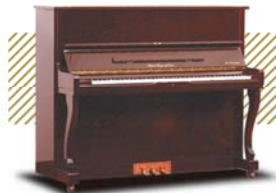
Wilson A-300 ¥280,800~ (税込み)