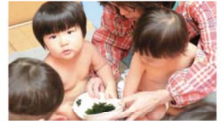
水で戻したワカメに触れる1歳児クラス

50年以上前「子どもを育てながら働ける環境を作ろう」と女性たちが民家の一角を借りて共同保育を始めたことが同保育園の原点。その意思は今も受け継がれ、職員と親が共に保育研究会に参加し学ぶなど、父母会の活動がとても盛んです。カラフルな園の外壁も、かつて保護者たちが協力して塗ったものだそう。「子育ての悩みや共働きの苦労を話せる仲間づくりを大切にしています。職員も親御さんと一緒に考えながら、より良い園を作るパートナーでありたいです」