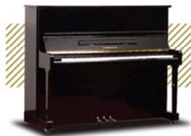
YAMAHA U1 ¥129,600~ (税込み)