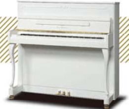
¥356,400~ ★アウトレット対象商品は (税込み) 25%~40%OFF!!