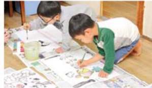
絵から子どもたちの心境が見えてきます

では遊びながら体を動かすことを重視し、「音楽リズムあそび」では歌に合わせてカエルになって跳ねたり、カメになって体を反らせたりする姿が。「ごっこ遊びで体を動かす楽しさ、気持ちよさを知ってもらいたいです。体と脳や心はつながっているので、元気に遊んだ子たちは考える