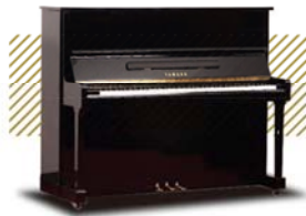
KAWAI KU-1 ¥194,400~ (税込み)