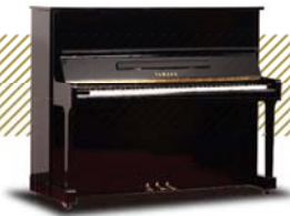
YAMAHA U3H ¥248,400~ (税込み)