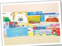
おなじみの絵本も英語!

入室してからは全ての会話が「英語のみ」。しかし、英語を学ぶだけの授業は一切ありません。あいさつ、ゲーム、おやつ時間など遊びや生活習慣の中で、子どもたちが日本語を身に付けるように自然と英語を習得していきます。子どもは楽しみながら学ぶので、英語を嫌いにすることもなく親しんでいます。