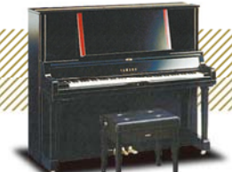
YAMAHA YU-5 ¥561,600~ (税込み)